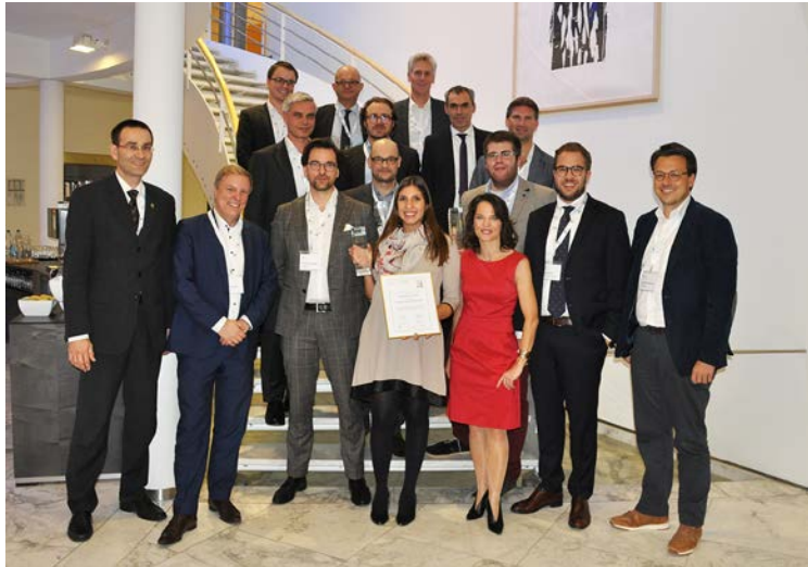
Award-Gewinner und Jury 2017

Das Kompetenzzentrum „Sourcing in der Finanzindustrie“ (CC Sourcing) der BEI AG ist ein universitätsübergreifendes Konsortialforschungsprojekt und greift das Thema Digital Business sowie die Transformation in Richtung digitale Bank auf und leistet mit Forschungsergebnissen Beiträge zur künftigen Ausgestaltung der Banken- und Finanzindustrie. Das Kompetenzzentrum ist ein Bereich der Business Engineering Institute St. Gallen AG.